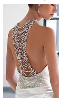
3. Escotes Espalda